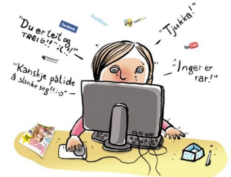
Baksiden ved sosiale media