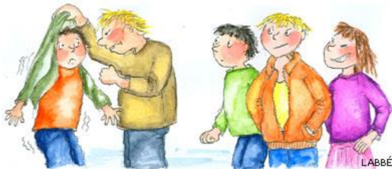
Vold og krenkelser